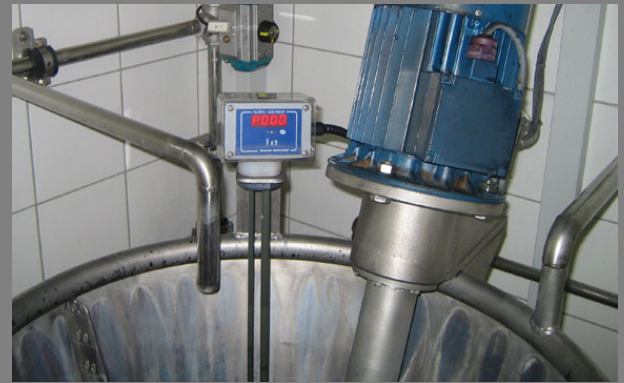
Farblösebehälter mit kontinuierlicher Niveaumessung