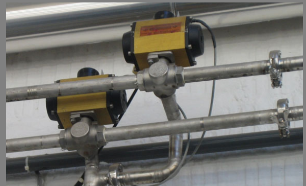
Transportleitungen mit Ventilen an den Maschinen