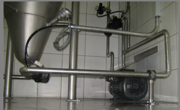
Edelstahl-Verrohrung mit Pumpe