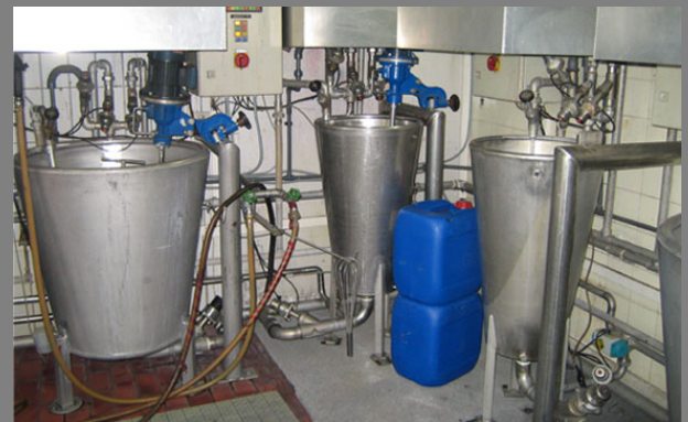
Lösebehälter in diversen Grössen mit Abzugshauben